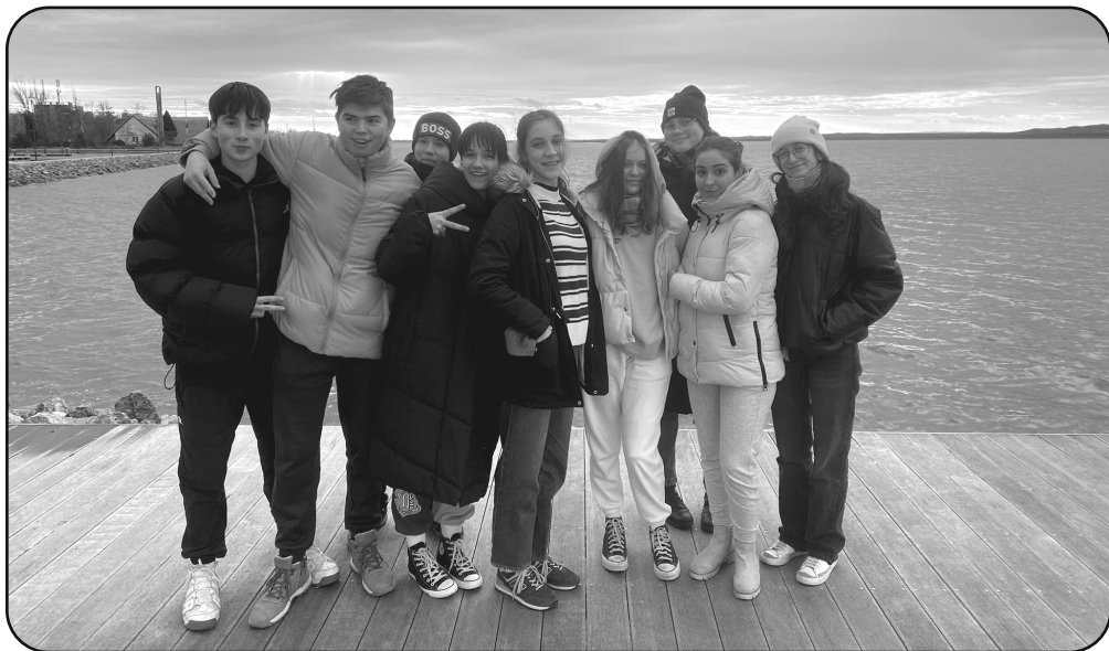
Ifi csendeshétvége Gárdonyban