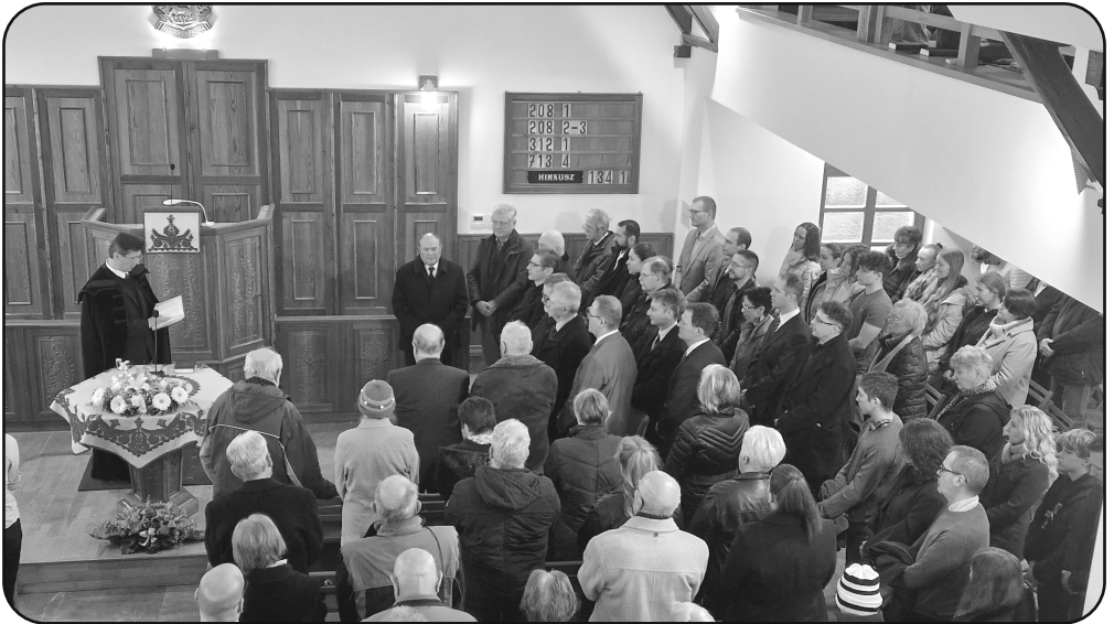
Tiszteletbeli presbiterek köszöntése és presbiteri fogadalomtétel 2024. február 11-én