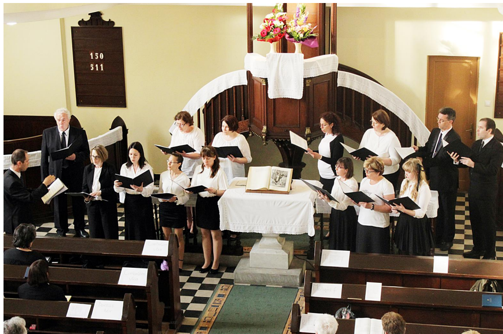
2023.május 7. Kórustalálkozó a Rákospalota-Óvárosi gyülekezetben