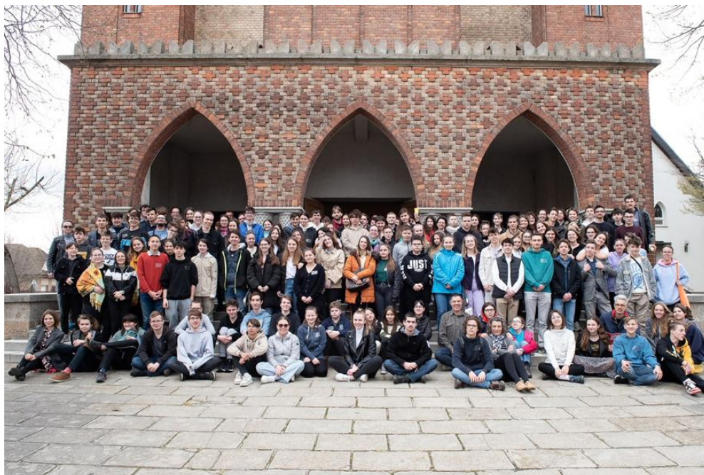
Egyházmegyei ifjúsági nap - csoportkép