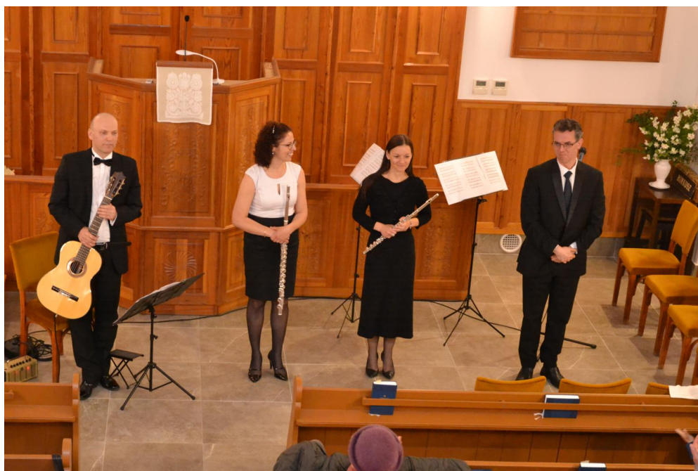
2023.május 14. Jótékonysági koncert