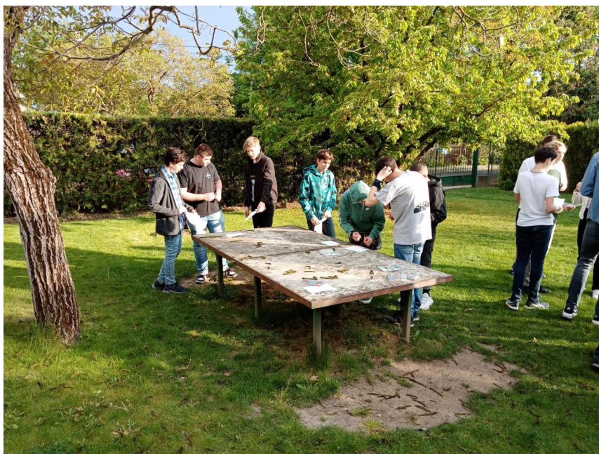
Első ifi alkalom a konfirmáltakkal