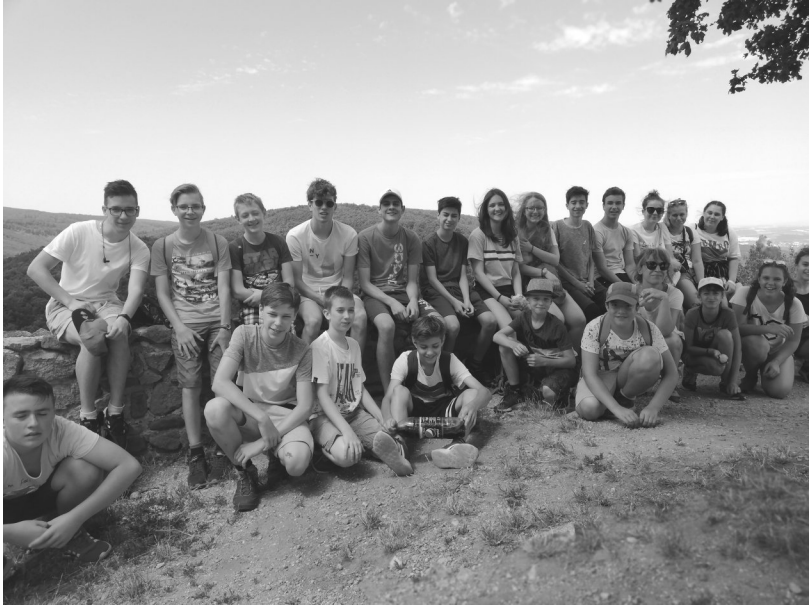
IFI tábor - Drégelypalánk, június