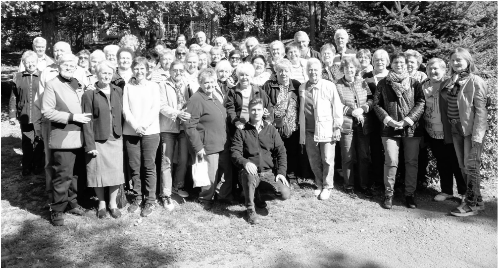
Őszi csendeshét - Mátraháza