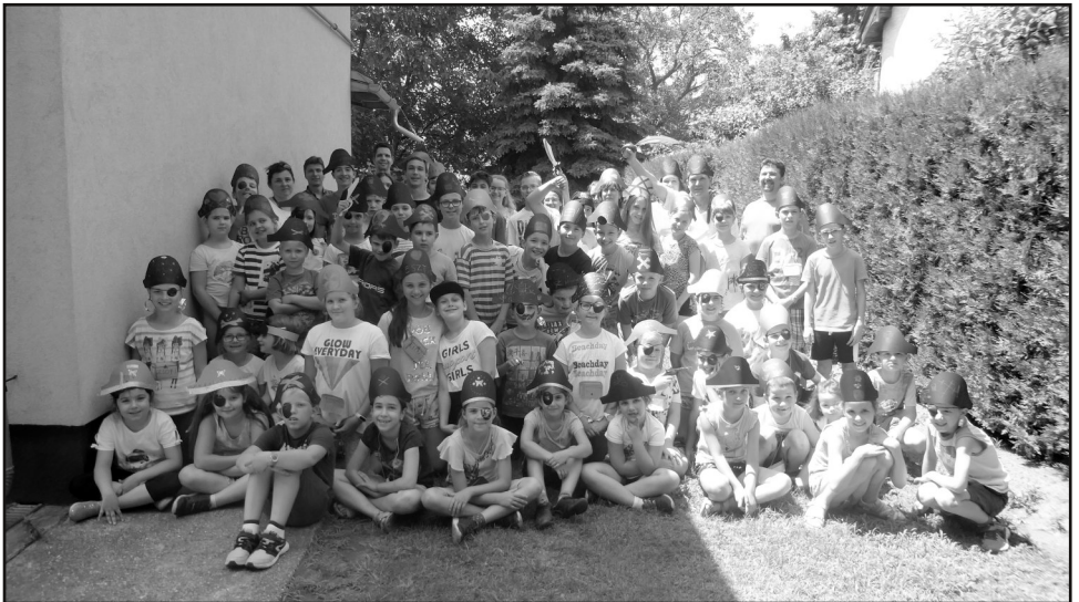
Gyülekezeti életképek - Hittantábor, július