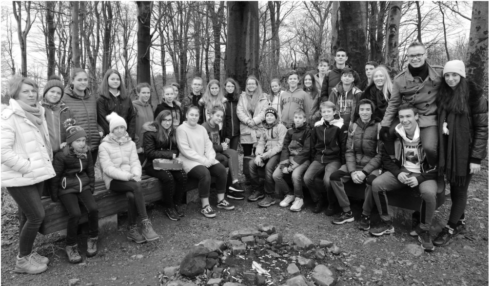
Gyülekezeti életképek - IFI hétvége novemberben, Galyatető

- Ha Isten velünk... Kezdhethjük!... Kérem intubálni !