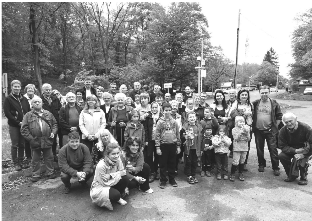
Gyülekezeti életképek - csendeshétvége, április