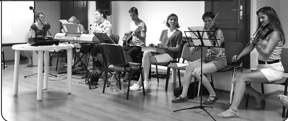
Családos csendeshét Balatonszárszón - július