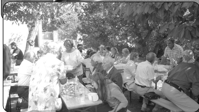
Gyülekezeti nap - szeptember